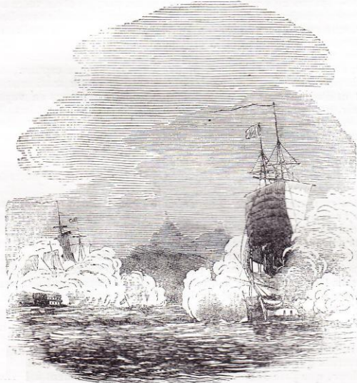
Salut d'adieux à l'Hermite.

L'Hermite vent s'élancer sur la plage, mais son pied ne la touche pas; saisi au milieu de son élan par cent bras enthousiastes, il est enlevé sur un pavois improvisé avec des avirons, et malgré les efforts que lui fait tenter sa modestie, malgré ses prières, malgré sa résistance, il est porté en triomphe au milieu des cris de joie de son nombreux cortège vers le palais du gouvernement.